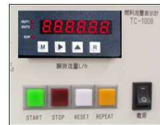
燃料流量表示計 TC-200B シリーズ 外形寸法 : W160×H100×D160