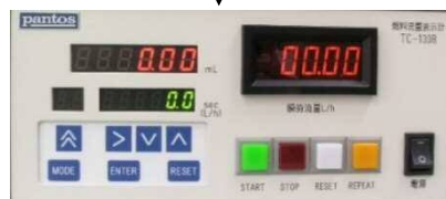
燃料流量表示計 TC-100B シリーズ 外形寸法 : W220×H99×D200