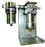
高圧システムタイプ

使用液粘度 : 0.5~1000cps 圧力 : 21Mpa 温度 : -40~90℃